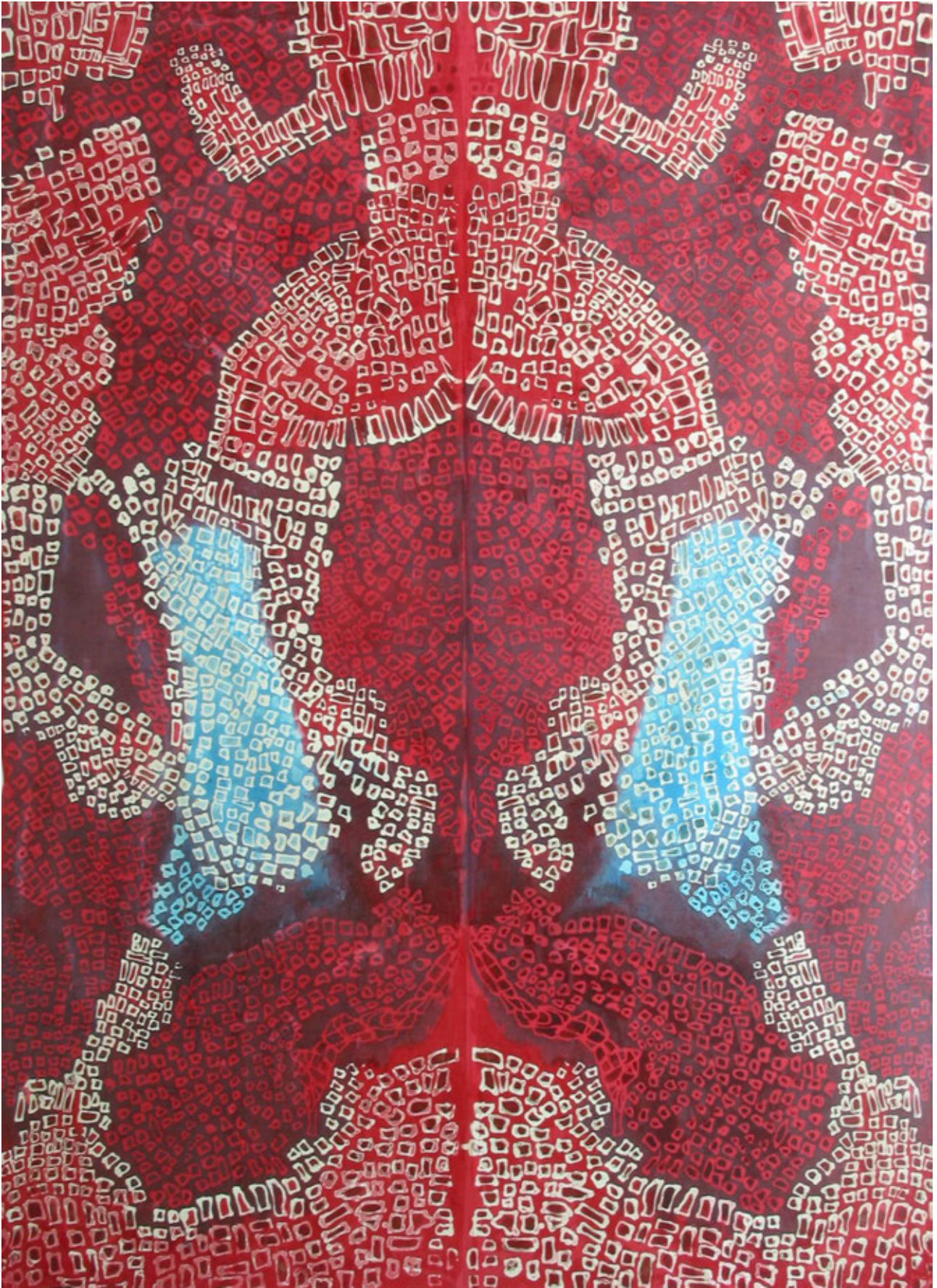
« Frog » Batik on silk 3 x 2.5 m